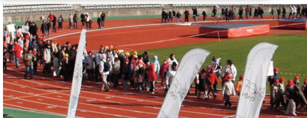
L'arrivée des jeunes sportifs au stade Charléty de Paris.

Le 1 er février, l'USEP a fêté ses 70 ans en organisant, entre autres, une "Traversée de Paris" (non compétitive) qui a réuni symboliquement 2 009 participants. Tout aussi symboliquement, les Usépiens ont démarré le parcours depuis l'école Jean Zay (du nom du ministre qui a signé, le 1 er février 1939, la circulaire de naissance de l'USEP) pour rejoindre le stade Charléty par l'avenue Pierre de Coubertin.