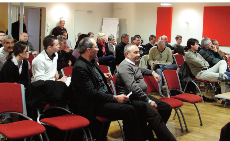
Colloque, Bocapôle de Bressuire, 29 mars 2009.

Une table ronde a permis de répondre aux questions du public.